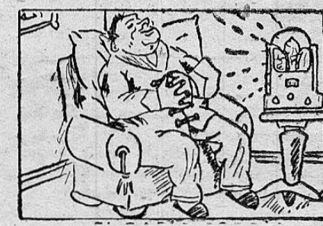
LA RADIO PROPIA