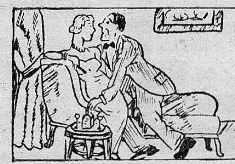
LA MUJER AJENA