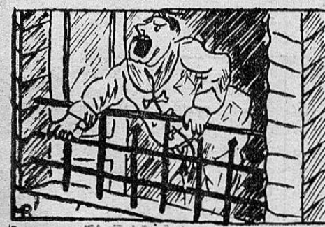
LA RADIO AJENA