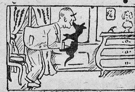
EL PERRO PROPIO