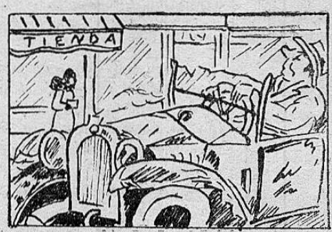
EL AUTO PROPIO