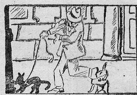
EL PERRO AJENO