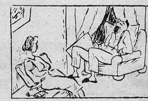
LA MUJER PROPIA